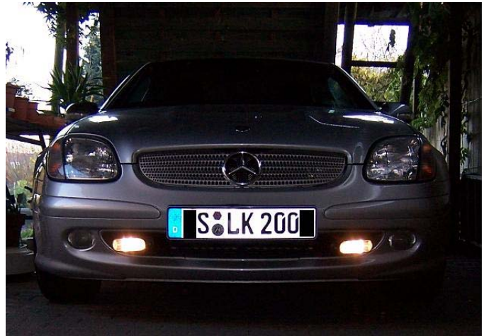
EIN aber wirkungsvoll