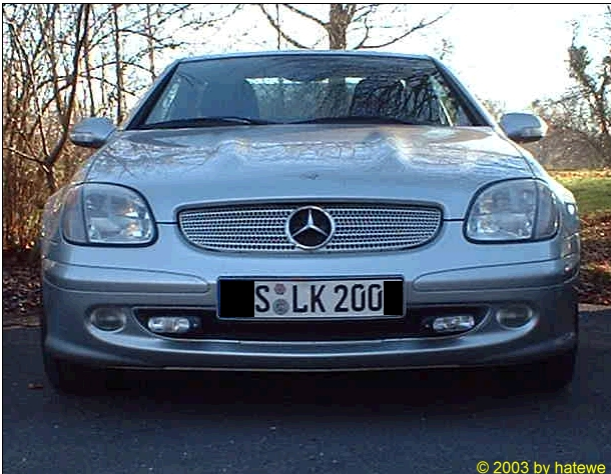
AUS relativ unauffällig

(M)Ein Beitrag zu mehr Verkehrssicherheit