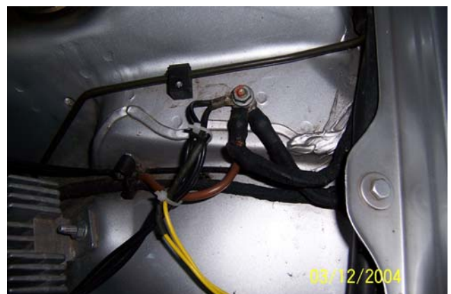
und Massepunkt Karosserie