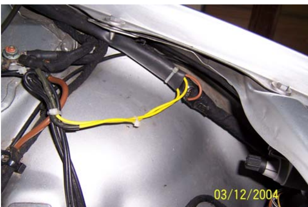
Kabelbrücke zu den Scheinwerfern