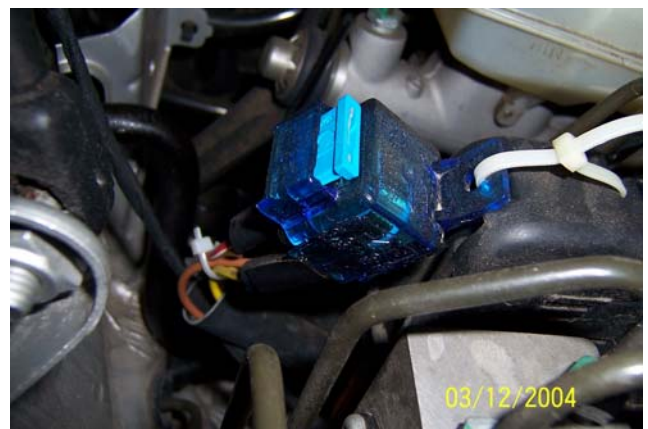
und Kabellauf in „Leerrohren“