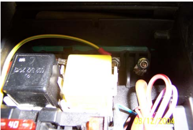
Geschaltetes Plus und Masse