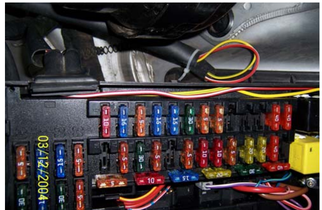
Kabellauf im Sicherungskasten