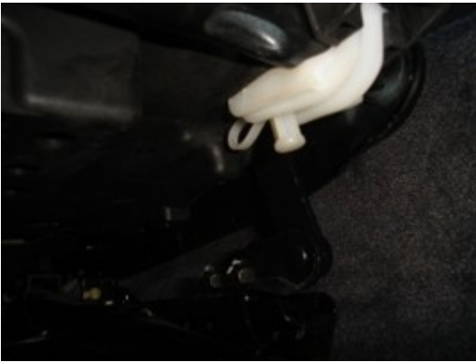
Hier in eingebauten Zustand

Auf der Sitzunterseite befinden sich ganz vorne zwei weiße Plastikclips, die entfernt werden müssen.