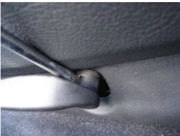
Als nächstes entfernen wir den Hebel der Sitzhöhenverstellung, indem man mit einem grossen Schlitzschraubendreher in die Nut des Verstellhebels fest hineindrückt und dann den Verstellhebel herauszieht.