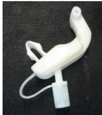
Hier in ausgebautem Zustand