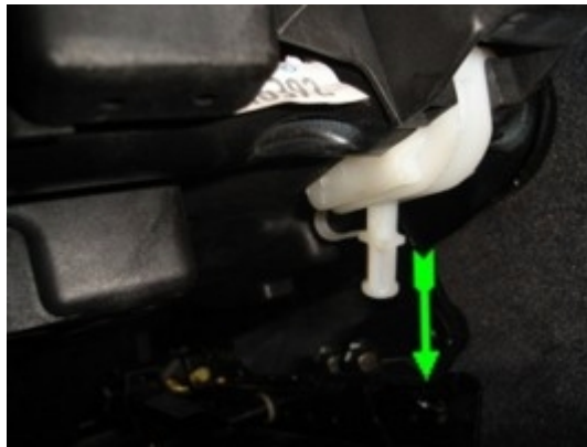
Als erstes den runden Sicherungsstöpsel nach unten ziehen