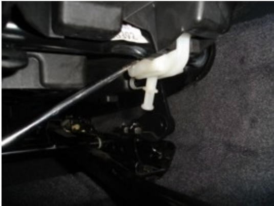
Mit einem Schlitzschraubendreher auf der Hinterseite aushebeln