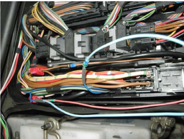
Bild 5: Habe den vorderen Stecker von dem Steuergerät abgezogen damit ich etwas mehr Platz für die Verbindungen hatte. Klemme 58 +61 habe ich über die beigefügten Klemmen abgegriffen, Klemme 65 durchtrennt und mit dem Modul verlötet.