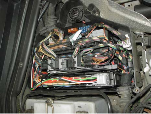
Bild 3: Platz ist in der kleinsten Hütte ;- ) hier muss es also hinein