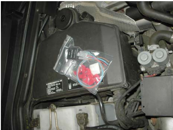
Bild 2: Modul mit Abgreifklemmen und Kabelbinder sowie Klebehalter