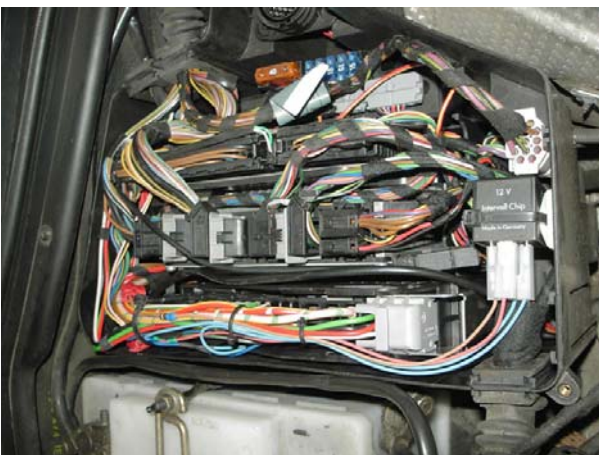
Bild 6: Vorderen Stecker aufgesteckt, alles wieder schön mit Kabelbinder zusammengebunden --- Fertig